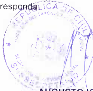
AUGUSTO IGLESIAS PALAU SUBSECRETARIO DE PREVISION SOCIAL