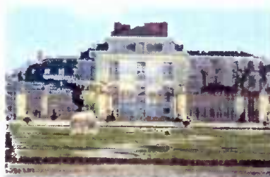
El Palacio de Versalles, sede del proyecto de hotel de lujo.

El proyecto de convertir una parte del Palacio de Versalles en un hotel de lujo, con 23 habitaciones y una suite presidencial, fue adjudicado a la empresa belga Icy International. La operación, que costará 5,5 millones de euros, será llevada a cabo por la empresa belga Icy International, que ya ha desarrollado otros proyectos de rehabilitación de edificios históricos en París. El hotel estará operativo a fines de 2011.