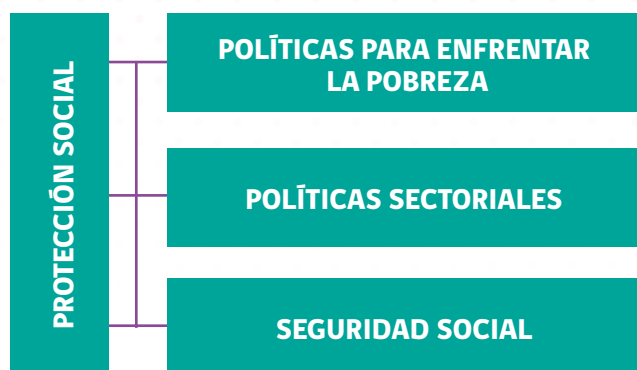
Figura 1: Diagrama Protección Social