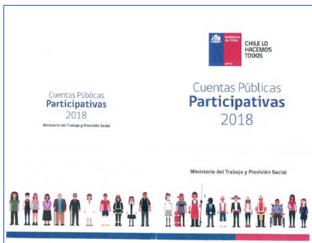
Imagen 2. Interior tarjeta participativa