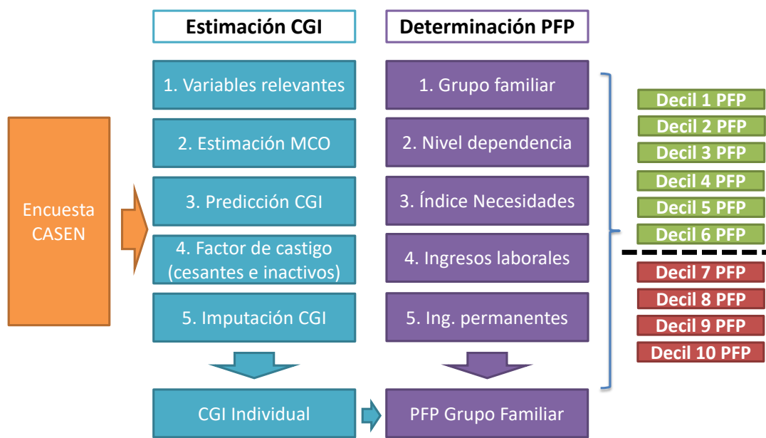
Figura 2: Determinación del umbral CASEN.